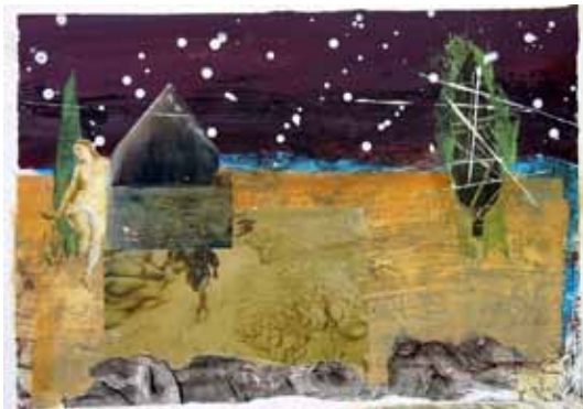
Renier Vaessen | 'Trees and signs of religion' | 2010 | Werk op papier | 32,5 x 50 cm.

Renier Vaessen kwam naar Montevettolini om te beginnen aan zijn boek 'Trees and Signs of Religion'. Het streven om zijn ideeën- en belevingswereld te implementeren in de Toscaanse omgeving resulteerde in de cyclus 'Cupressus sempervirens'. De kunstenaar adopteerde een cipres op de torro della murale waarop hij vanuit zijn werkruimte uitkeek. Hij maakte onder meer een tekening op ware grootte van de cipres die uitgroeit tot een metafoor voor het Toscane dat zich voor het geestes-oog van Renier Vaessen ontvouwt. In zijn werk versmelten architectuurelementen, mensbeelden, lichaamsfragmenten, voorwerpen (variërend van een theepot en huishoudtrapje tot vleeshaken, stukken bestrating en resten van een geruïneerde muur), beeldcitaten uit werk van illustere voorgangers en foto's uit oude archieven tot een nieuwe werkelijkheid die associatieve processen aanwakkerd.