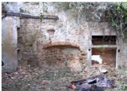
Voor de grote restauratie.