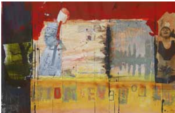
‘Trees and signs of religion’ | 2010 | Werk op papier | 32,5 x 50 cm.