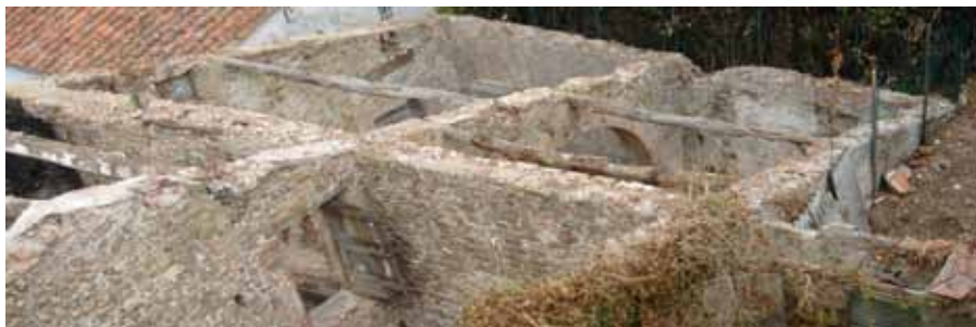
Frantoio, een oude olijmolen, in 2005 nog een ruïne uit de 14e eeuw.