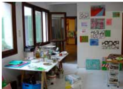
De woonkamer en het atelier nu.