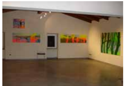
Projectruimte boven in de Frantoio